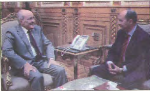
«العصار» و«نصار» خلال اجتماعهما

ناقش الدكتور محمد سعيد العصار وزير الدولة للإنتاج الحربي والمهندس عمرو نصار وزير التجارة والصناعة، مجالات التعاون المشترك بين الوزارتين. قال «العصار» إنه تم بحث إمكانية تصنيع قطع الغيار والصناعات المكملة لصناعة السيارات، حيث تمتلك السوق المصرية كل الإقومات التي تؤهلها لتصنيع محروا صناعيا ولوجستيا في إفريقيا والشرق الأوسط، كما تمت مناقشة إمكانية إنشاء مجمع صناعات متكامل لتصنيع الأجزاء